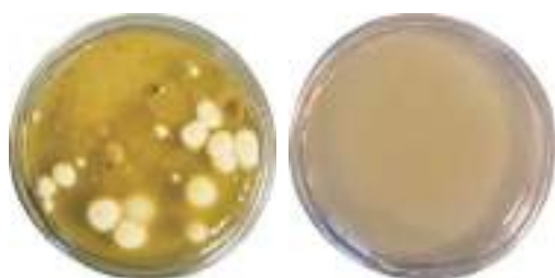
U.T.A. 2 BLOCCO OPERATORIO - VERTICALE

I risultati sono espressi in UFC/24 cm 2