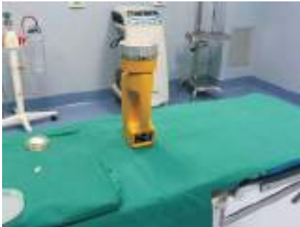
Campionatore Microbico dell'Aria